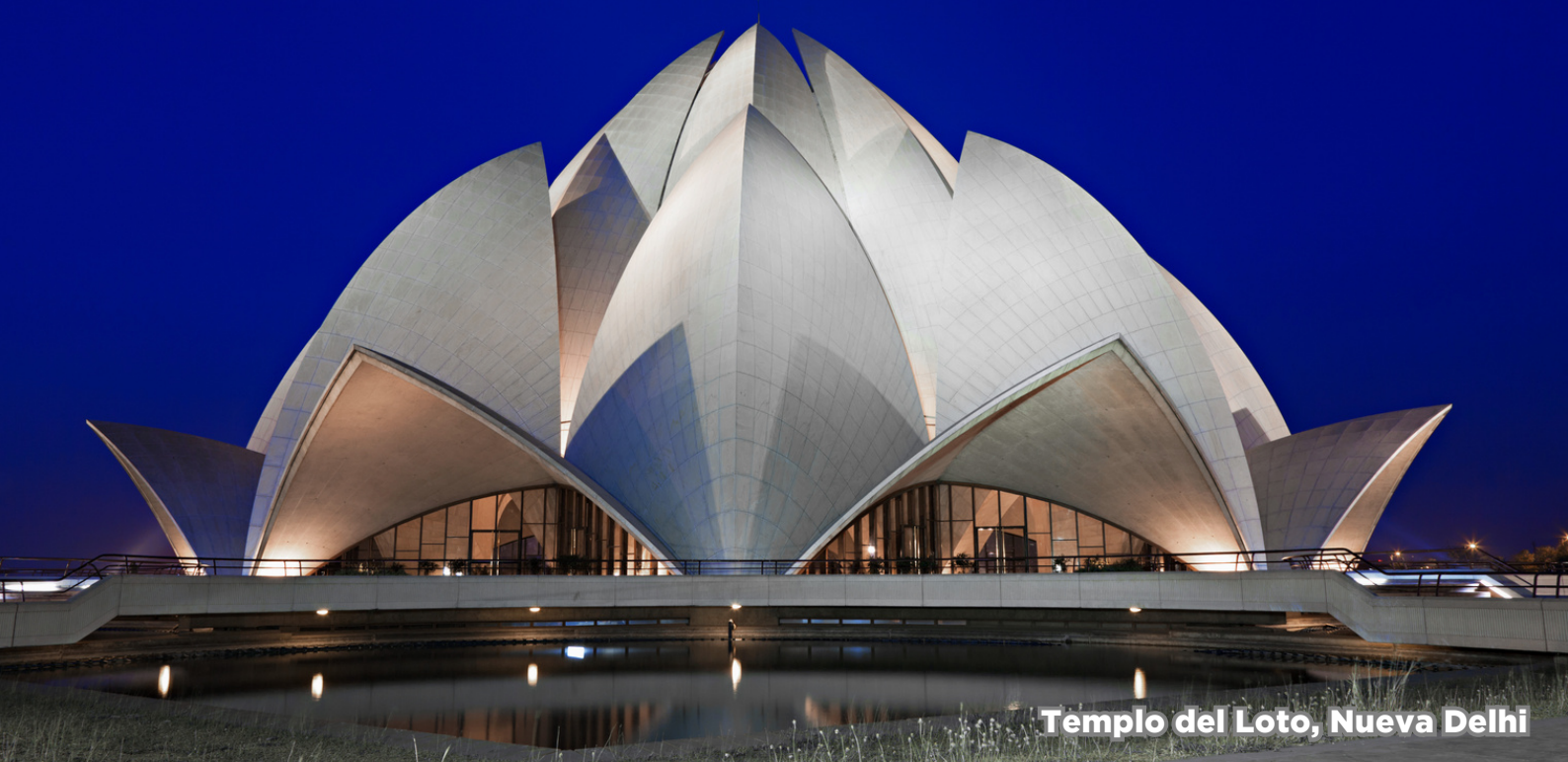
Templo del Loto, Nueva Delhi