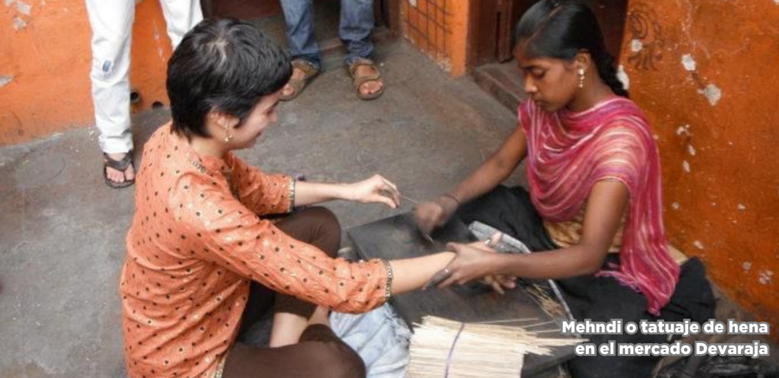
Mehndi o tatuaje de hena en el mercado Devaraja

un templo hindú Vaishnava a orillas del río Kaveri en Somanathapura, Karnataka, India. El templo fue consagrado en 1258 CE por Somanatha Dandanayaka, un general del rey Hoysala Narasimha III.