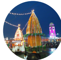
Har Ki Pauri