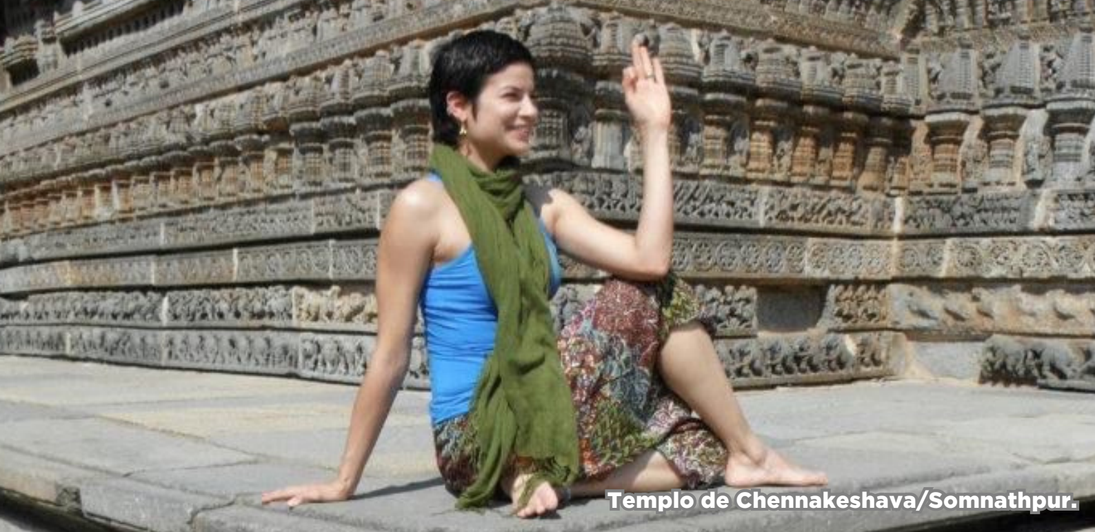
Templo de Chennakeshava/Somnathpur.