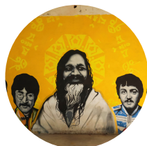
Ashram Los Battles