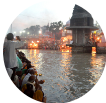
Arati Río Ganges